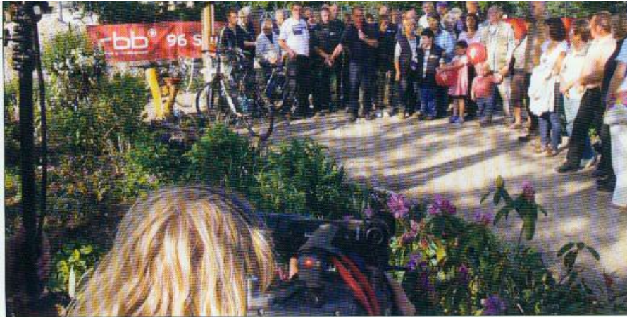
Viele Helfer von nah und fern waren angetreten, um die Interkulturellen Gärten in der Blohnstraße in Lichtenrade auf Vordermann zu bringen.

Titel: rbb und radio Berlin 88,8-Aktion 96 Stunden war voller Erfolg