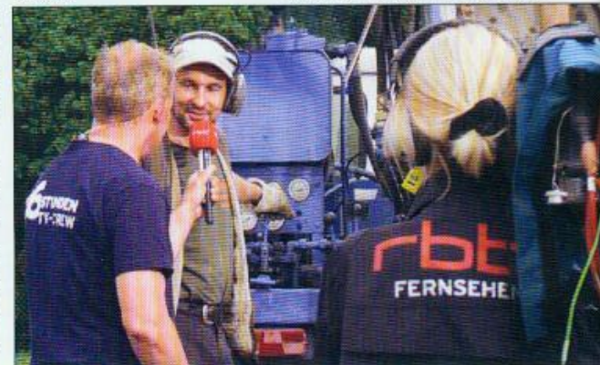
Die Kameras und Mikrofone waren immer dabei in den 96 Stunden

Auch eine neu entstandene Sportfreundschaft ist Ausdruck dieses Zusammengehörigkeitsgefühls. Ein Verein aus Lichtenrade will eine Beach-Volleyball-Anlage spen-